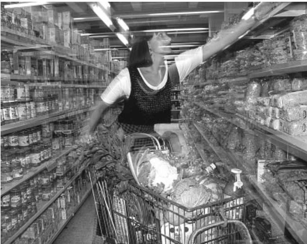
Für den Erfolg von Produkten beim Konsumenten ist Marketing heute unverzichtbar.

DERERFOLGEINESUNTERNEHMENSHÄNGTHEUTEWENIGERVONDERFÄHIG KEITABDIEPRODUKTIONRATIONELLZUGESTALTENUNDZULEITENSONDERN VIELMEHRDAVONLOHNENDEABSATZMÄRKTEZUFINDENUNDSICHAUFDIES EMÄRKTEEINZUSTELLEN