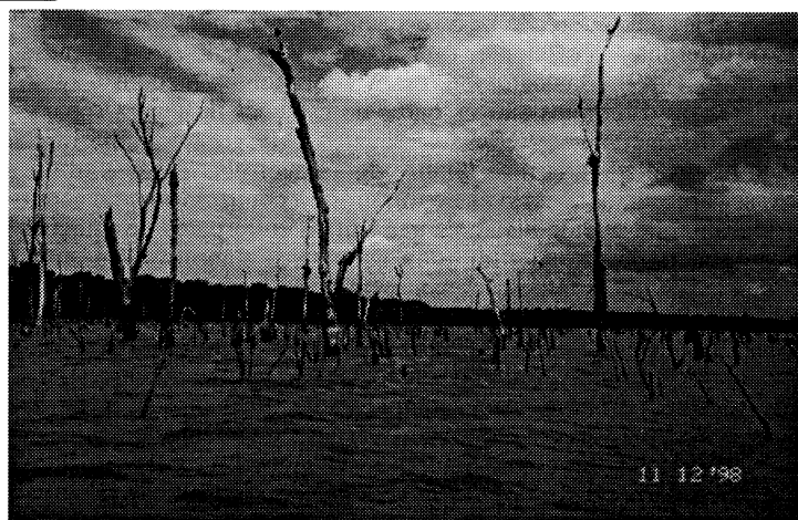
Efeito de 16 anos de alagamento sobre troncos e galhos. Reservatório de Itaipu em período de depleção.

elevados custos com a remoção. Entretanto, o excesso de vegetação alagada pode resultar em uma série de problemas, que podem neutralizar, em alguma extensão, as vantagens. Entre esses problemas destaca-se a anoxia em regiões mais profundas, que pode levar a mortandades de peixes ou limitar sua distribuição no novo ambiente. Além disso, troncos submersos podem interferir na navegação, recreação, redes de pesca, e servir como suporte para bancos de macrófitas.