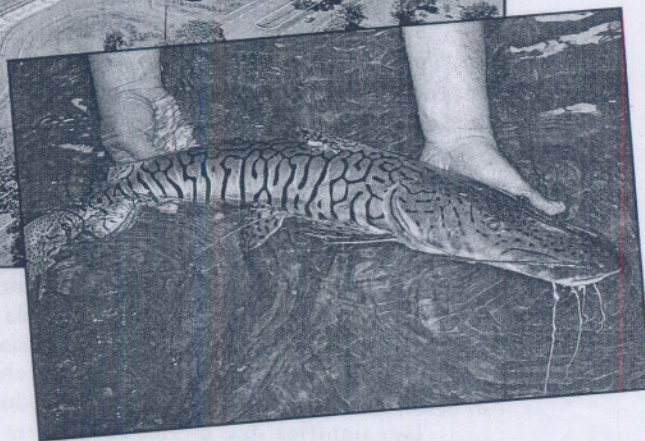
Recuperação de um pintado após a cirurgia para implante de radiotransmissor.

O Paraná é o principal rio da Bacia do Prata e o segundo maior em extensão da América do Sul. Desde sua nascente, na Serra da Mata da Corda (MT) até a foz do Rio Uruguai, ele percorre aproximadamente 3.809 km. A Bacia do Alto Paraná drena uma área com grandes centros urbanos, industriais e agrícolas e se constitui na região mais intensivamente explorada do País e possui 48,7% da área total de drenagem.